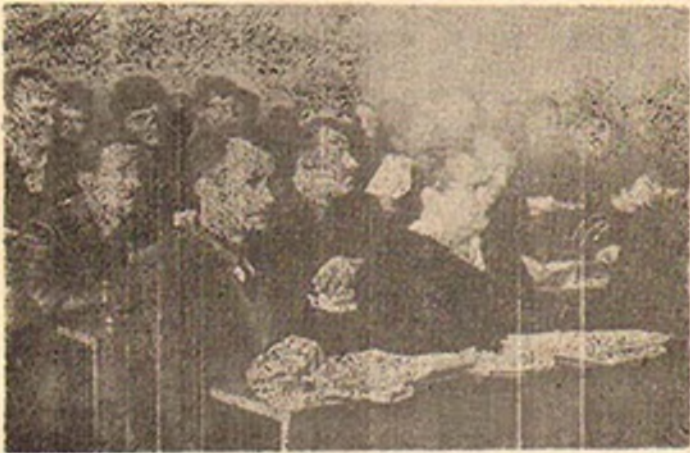
Са седнице Општинске скупштине

трали извештаје о раду Скупштине током прошле године, извештаје о раду органа Управе и инспекцијских служби СО, затим извештај о раду Одељења за унутрашње послове. Успех ученика на крају првог полугодишта такође је заузео видно место у извештају и дискусијама одборника.